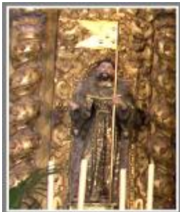
Imagen de madera encarnada y policromada, estofada con decoraciones floral de escuela sevillana barroca (siglo XVII), es el diacono fundador de la Orden de los Frailes Menores (1209), por lo que presenta habito de la Orden (túnica y capilla marrones, cordón blanco), y bandera de fundador en la maquina izquierda (de metal dorado, ondeando el escudo de la Congregación, de las cinco llagas). Lleva cerquillo de fraile, barba y bigote y los estigmas en mano y pies, que recibió en un éxtasis en el monte Alverna.