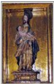
Imagen estante, de madera encarnada, estofada y policromada, que porta al Niño Jesús siguiendo el modelo iconográfico impuesto en la escuela sevillana por Pedro Roldán, cuyo taller domina la segunda mitad del siglo XVII. La presente escultura cuya decoración de rocalla confirma su adscripción al siglo XVIII, es de clara influencia estilística roldanesca. Aparece joven y barbado, con amplia túnica, sobre la que se cruza el manto como símbolo de su virginidad.