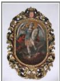
Imagen estante del Arcángel jefe de las milicias angélicas, de madera encarnada, estofada y policromada. Conforme a la iconografía tradicional, aparece alado con uniforme militar a la usanza romana, coturnos y casco empenachado. En su mano izquierda la espada y en la derecha un escudo, por atribuírsele el papel de psicopompo o portador de las almas a su destino definitivo (infierno o gloria). Como el resto del retablo pertenece al siglo XVIII.