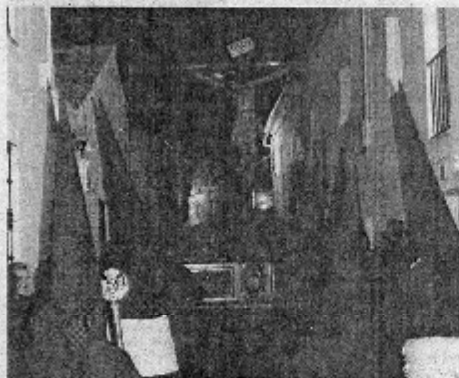
Se ultimán los preparativos para esta celebración.

En el caso de El Pedroso es sobre la Hermandad del Santísimo Cristo de la Misericordia y Nuestra Señora de los Dolores en la que recae el peso de esta labor. Por ello diseñaron un completo programa de cultos que comenzó el pasado 19 de febrero con el Solemne Via Crucis Cuadrosal, jornada en la que los asistentes cantaron versos desde la Ermita de la Hermandad. Ya el 12 de marzo se procedió al traslado del Santísimo Cristo y las Dolores desde su Ermita a la Parroquia después de la Santa Misa de la tarde. Del 16 al 20 de este mes tuvo lugar el Solemne Quinario al Santo Cristo de la Misericordia en la Iglesia Parroquial. Para concluir con las eventos previos a la Semana Santa, el 21 de marzo se sucedió la Función Principal de Hermandad, que estuvo acompañada por los cantos litúrgicos del Coro de El