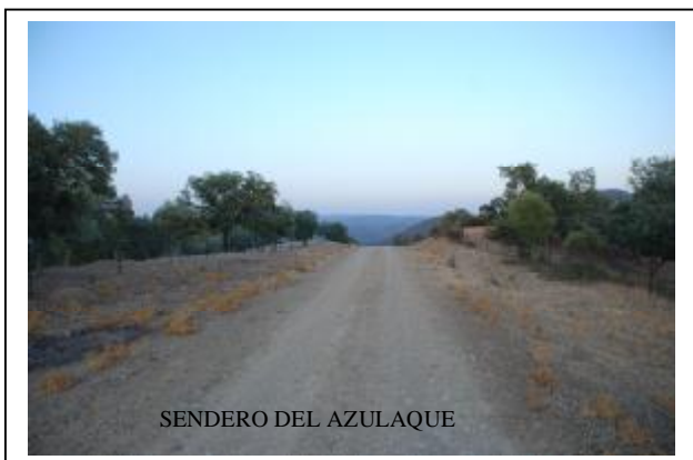
LUGAR DESTINADO AL MIRADOR Y QUE EN BREVE SE INICIARA SU CONSTRUCCIÓN