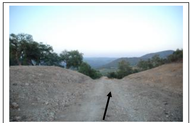
LUGAR DESTINADO AL MIRADOR Y QUE EN BREVE SE INICIARA SU CONSTRUCCIÓN