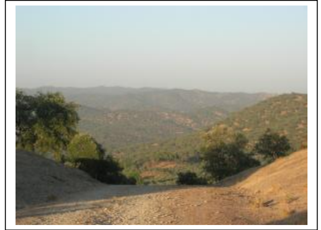
KM. 6. PANORAMICA DESDE EL PROXIMO MIRADOR