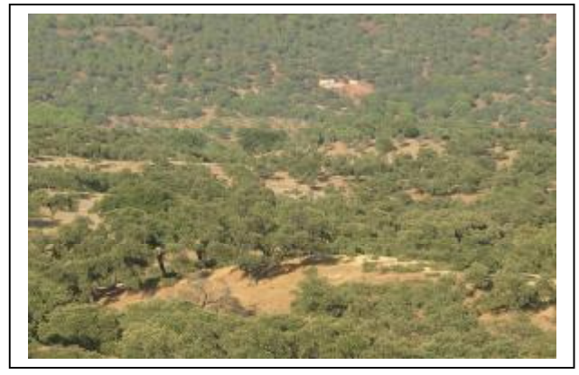
PANORAMICA DESDE EL MIRADOR A CONSTRUIR