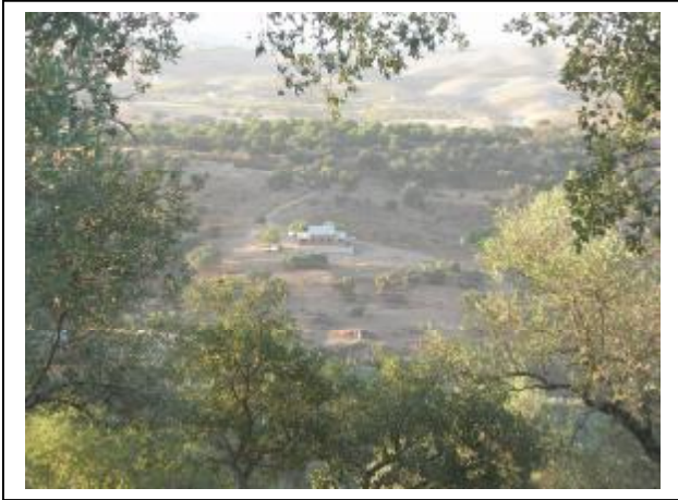
PANORAMICA DESDE EL PROXIMO MIRADOR