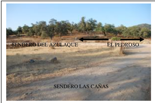
UNION DEL SENDERO DE LAS CAÑAS CON EL NUEVO SENDERO DEL AZULAQUE PENDIENTE DE SEÑALIZAR. KM. 0