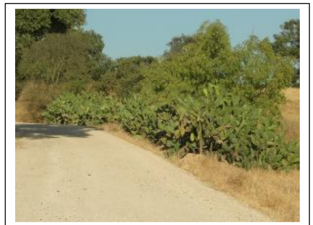
SENDERO LAS CAÑAS C° NAVA HONDA A EL PEDROSO