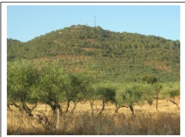
CERRO LA LIMA. DIRECCION EL PEDROSO